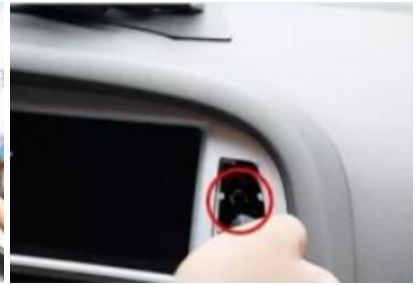
18. Entfernen Sie die Befestigungsschrauben der originalen Blende.