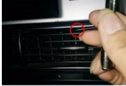
22. Öffnen Sie mit einer Pinzette den integrierten Verschluss des zentralen Luftauslasses des Originalfahrzeugs.