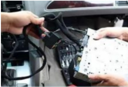
34. Der Kabelbaum des Originalfahrzeugs wird mit dem unseres Unternehmens verbunden