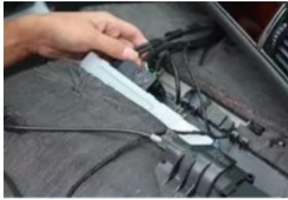
16. Ziehen Sie den originalen Motorstecker ab