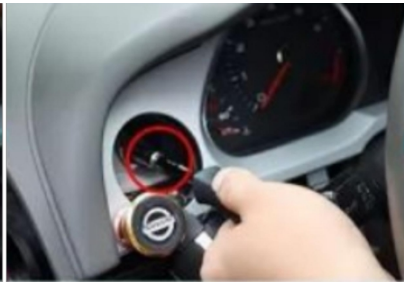
26. Entfernen Sie die Befestigungsschrauben der ursprünglichen Scheibe