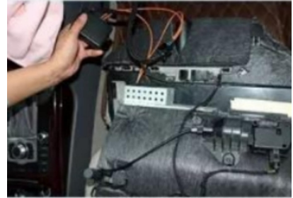
33. Übertragen Sie die ursprüngliche Fahrzeug-Glasfaserleitung