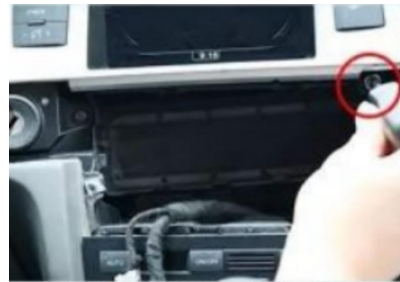
7. Entfernen Sie die Befestigungsschrauben der Original-Bildschirmblende