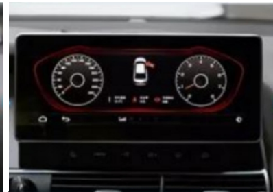
38. Effektbild nach der Installation (Meter)