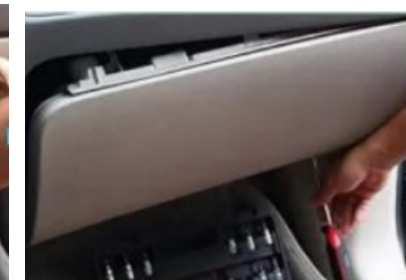
15. Entfernen Sie die Befestigungsschrauben des originalen Handschuhfachs