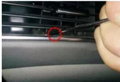
19. Verwenden Sie eine Pinzette, um den eingebauten Schnappverschluss des originalen zentralen Luftauslasses des Fahrzeugs aufzubrechen