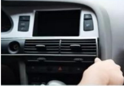
4. Hebeln Sie die zentrale Steuerungsluftabflussblende des Originalfahrzeugs mit einem Hebelbrett ab.