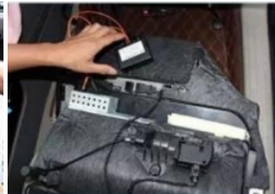
35. Position der Glasfaserbox: Die Glasfaserleitung ist ein empfindliches Produkt und darf nicht um 90° gebogen werden.