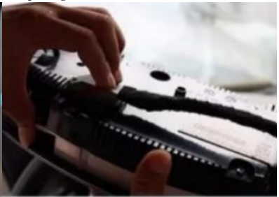
27. Entfernen Sie die ursprüngliche Instrumententafel und entfernen Sie den Stecker