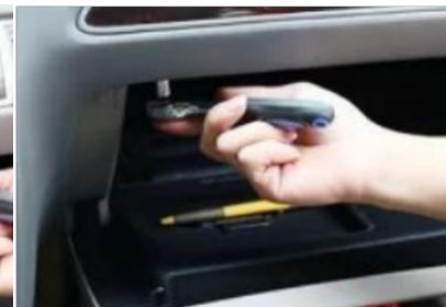
12. Entfernen Sie die Befestigungsschrauben des originalen Handschuhfachs