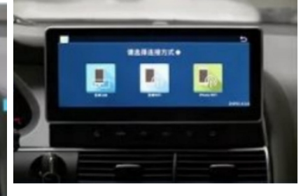
38. Effektbild nach der Installation (mobiles Internet)