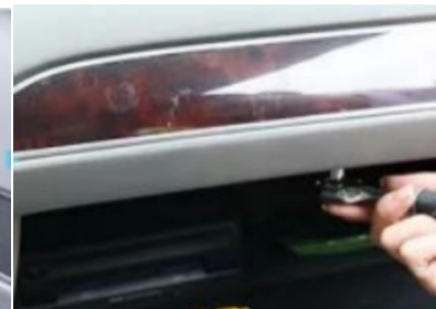
11. Entfernen Sie die Befestigungsschrauben des originalen Handschuhfachs.