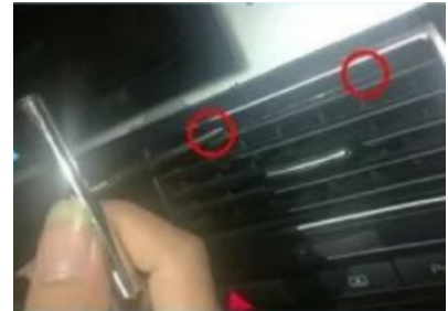
3. Verwenden Sie eine Pinzette, um den integrierten Verschluss der zentralen Luftdüse des Originalfahrzeugs aufzubrechen.