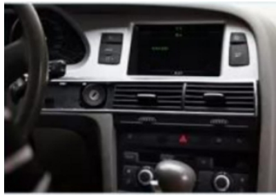
1. Zentrale Steuerung des Originalfahrzeugs