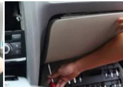
14. Entfernen Sie die Befestigungsschrauben des Original-Handschuhfachs.