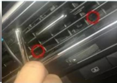
2. Lösen Sie mit einer Pinzette den integrierten Schnappverschluss der zentralen Luftzufuhrblende des