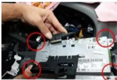
28. Entfernen Sie die Befestigungsschrauben der Original-Scheibe.