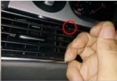
20. Öffnen Sie mit einer Pinzette den integrierten Schnappverschluss des originalen zentralen Luftauslasses des Fahrzeugs.