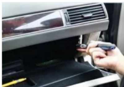
Befestigungsschrauben des originalen Handschuhfachs.