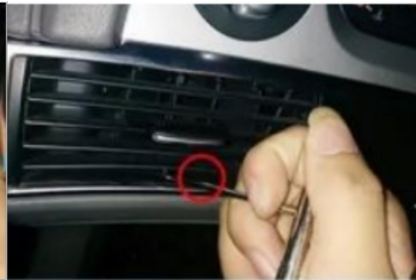
21. Verwenden Sie eine Pinzette, um den integrierten Verschluss des zentralen Luftauslasses des Originalfahrzeugs aufzubrechen.