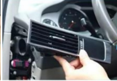
23. Entfernen Sie die Klimaanlageblende.