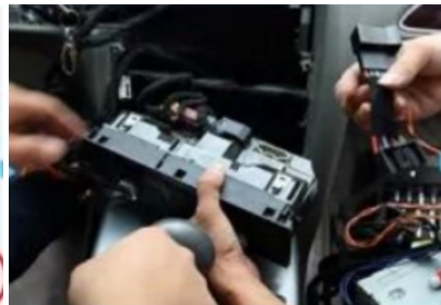
29. Entfernen Sie die ursprüngliche Klimaanlageblende