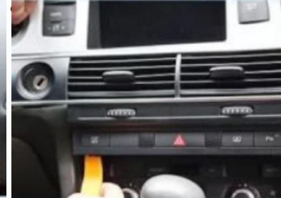
5. Hebeln Sie die zentrale Steuerungsluftabflussblende des Originalfahrzeugs mit einem Hebelbrett auf.