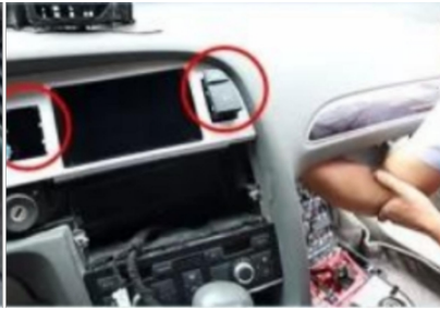
17. Drücken Sie den Handschuhfachschalter von innen heraus