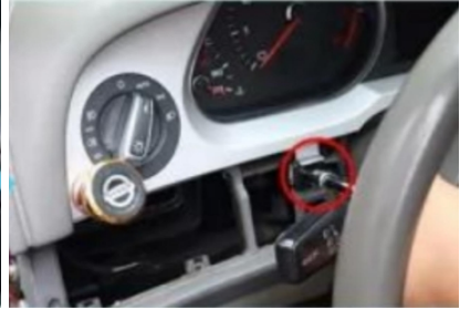
24. Entfernen Sie die Befestigungsschrauben der ursprünglichen Scheibe.