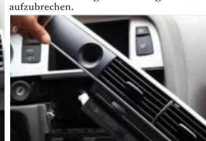
6. Hebeln Sie die zentrale Luftverteilungsblende des Originalfahrzeugs mit einem Hebelbrett auf.