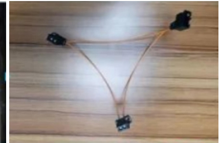
36. Die Glasfaserleitung ist ein empfindliches Produkt und darf nicht um 90° gebogen werden.