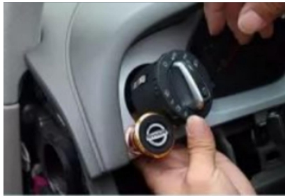
25. Entfernen Sie die Befestigungsschrauben der ursprünglichen Scheibe.