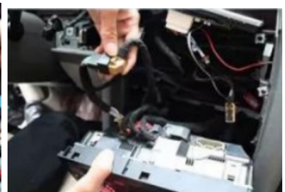
30. Übertragen Sie die Protokollzeile auf die Original-Klimaanlagenkonsole des Fahrzeugs